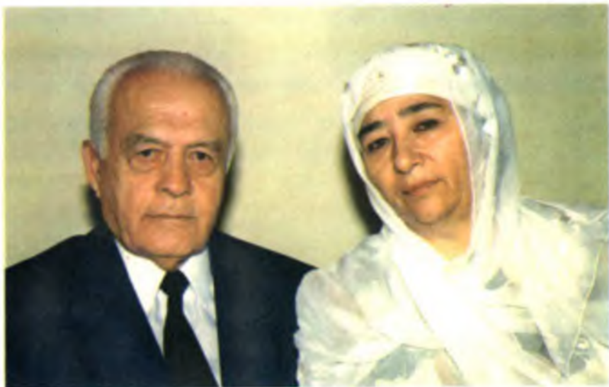
Ярим асрдан буён ёнма-ён.