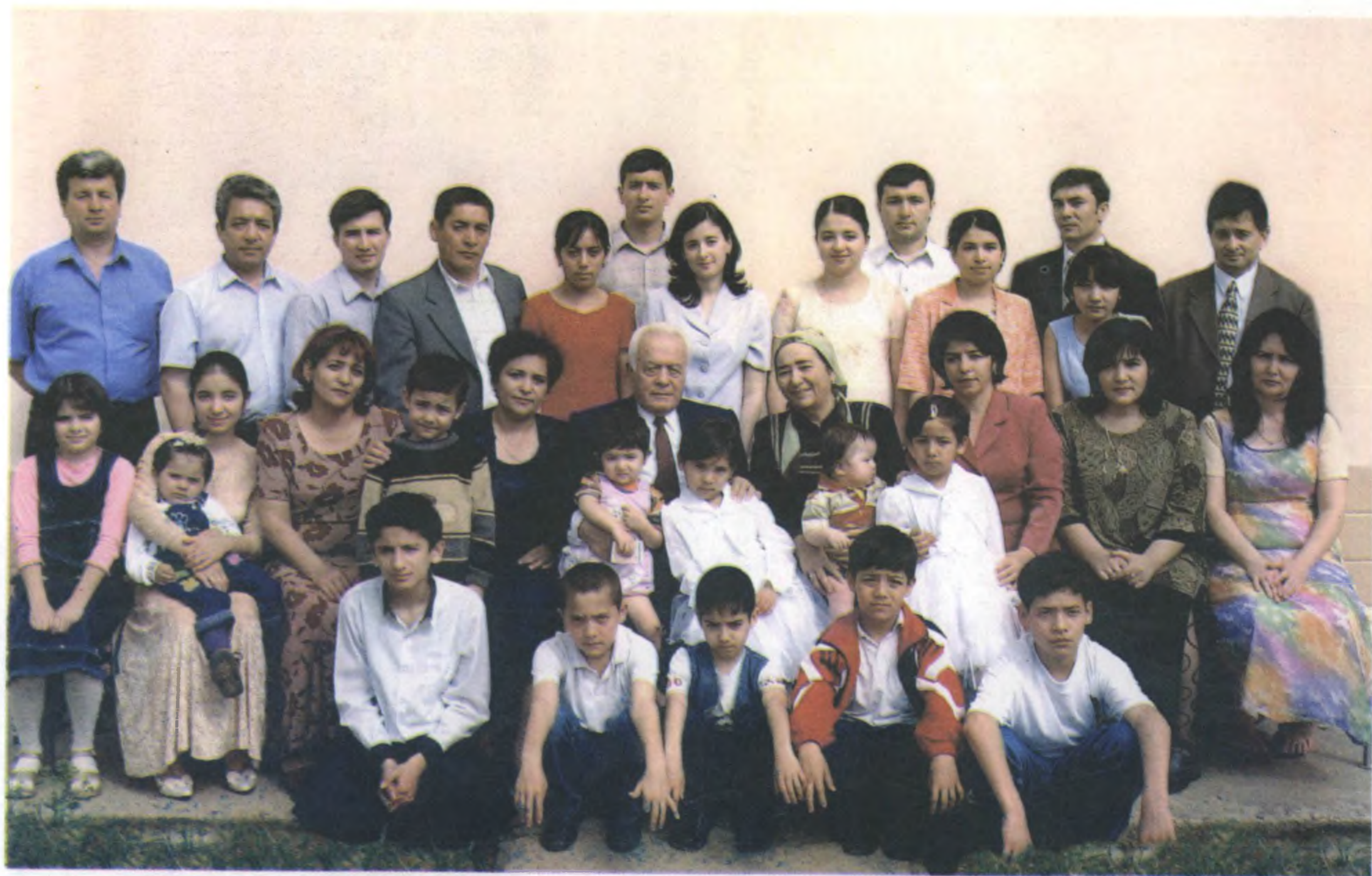
Пири бадавлат оила.