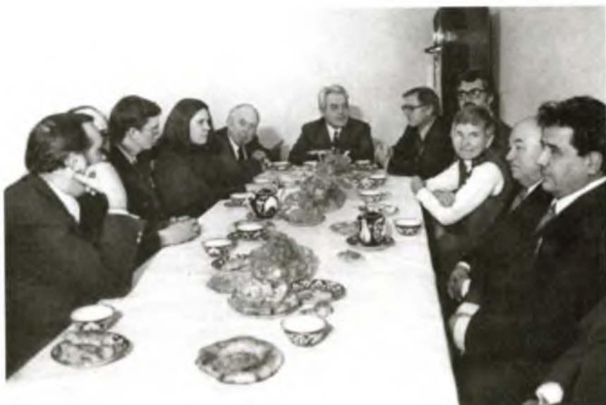
Тарих институтида чет эллик олимлар билан учрашув (1978 йил).