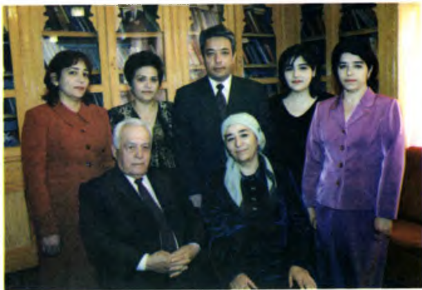
Ўғил-қизлар камоли — ота-она бахти.